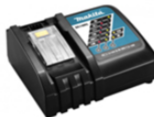
Nouvel enregistrement de garantie de chargeur