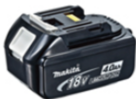
Nouvel enregistrement de garantie de la batterie