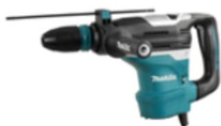
Nouvel enregistrement de garantie de la machine